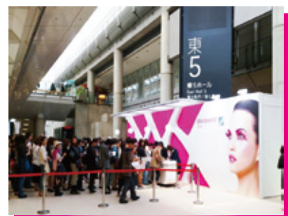
今年も入場を待つ行列ができた大人気の3日間