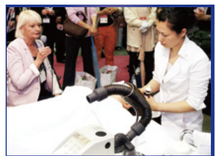
ジョジアンヌ ロールメソッドをプレゼンテーション