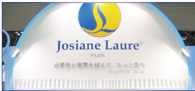
“必要性と” …原文『Aller plus loin au-delà de nos nécessités et nos limites.』