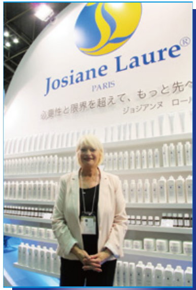
日本の皆様の美意識の高さ、その情熱に感動しました!